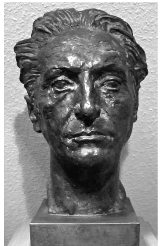
Georg Kolbe: Bronzestatuette von Hans Prinzhorn 1932

ein. Er kam zu dem Schluss, dass kein inhaltliches oder formales Gestaltungsmerkmal eines Werkes ausreiche, um auf den psychischen Zustand des Urhebers zu schließen. Er hielt es für oberflächlich und falsch, aus Ähnlichkeiten der äußeren Erscheinung (eines Werkes) Gleichheit der dahinter liegenden seelischen Zustände zu konstruieren. Einen Schluss: dieser Mensch malt wie jener Geisteskranke, deshalb ist er auch geisteskrank, lehne er ab. Das sei eine Argumentation auf dem Niveau: Pechstein, Heckel u.a. machen Holzfiguren wie Kamerunneger, deshalb sind sie Kamerunneger. Das Buch, das sich auf der Grenze zwischen Psychiatrie und Kunst bewegt, gilt bis heute als eines der wichtigsten Bücher zur Erforschung der Psychologie und Psychopathologie des künstlerischen Ausdrucks. Bis heute sind fünf Auflagen erschienen sowie eine englische (1972) und eine französische (1984) Übersetzung.